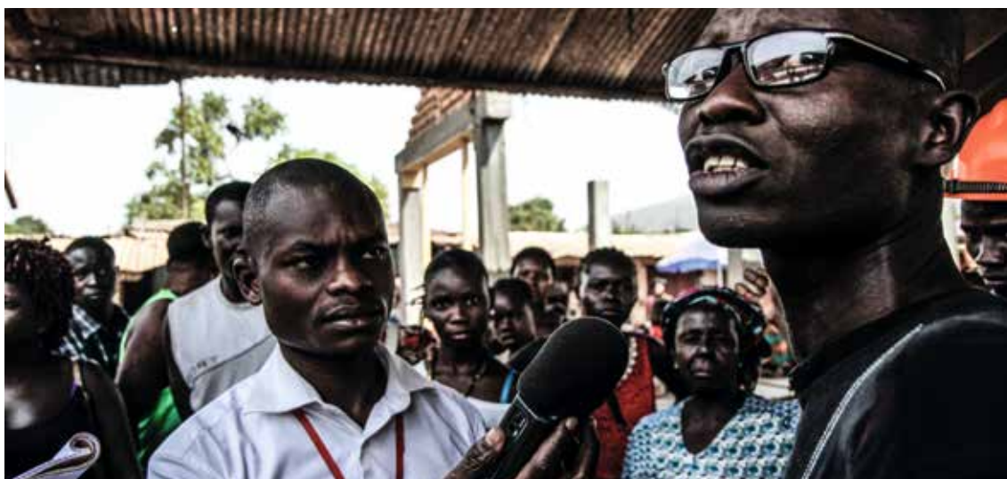
Reportage de Radio Ndeke Luka (République centrafricaine)