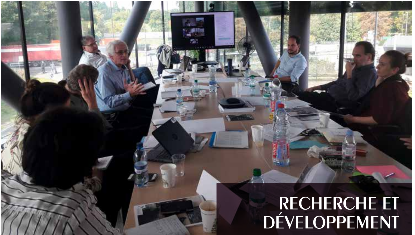
Atelier sur la mesure de l'impact des projets médiatiques, Maison de la paix à Genève, septembre 2017