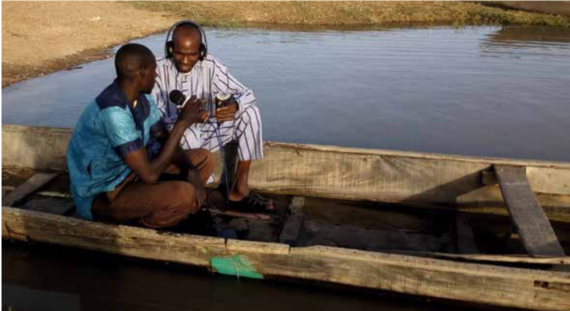
Reportage de Studio Kalangou sur le fleuve Niger