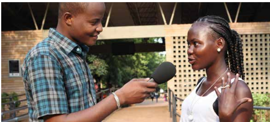
Interview d'une habitante de Bamako par un reporter de Studio Tamani