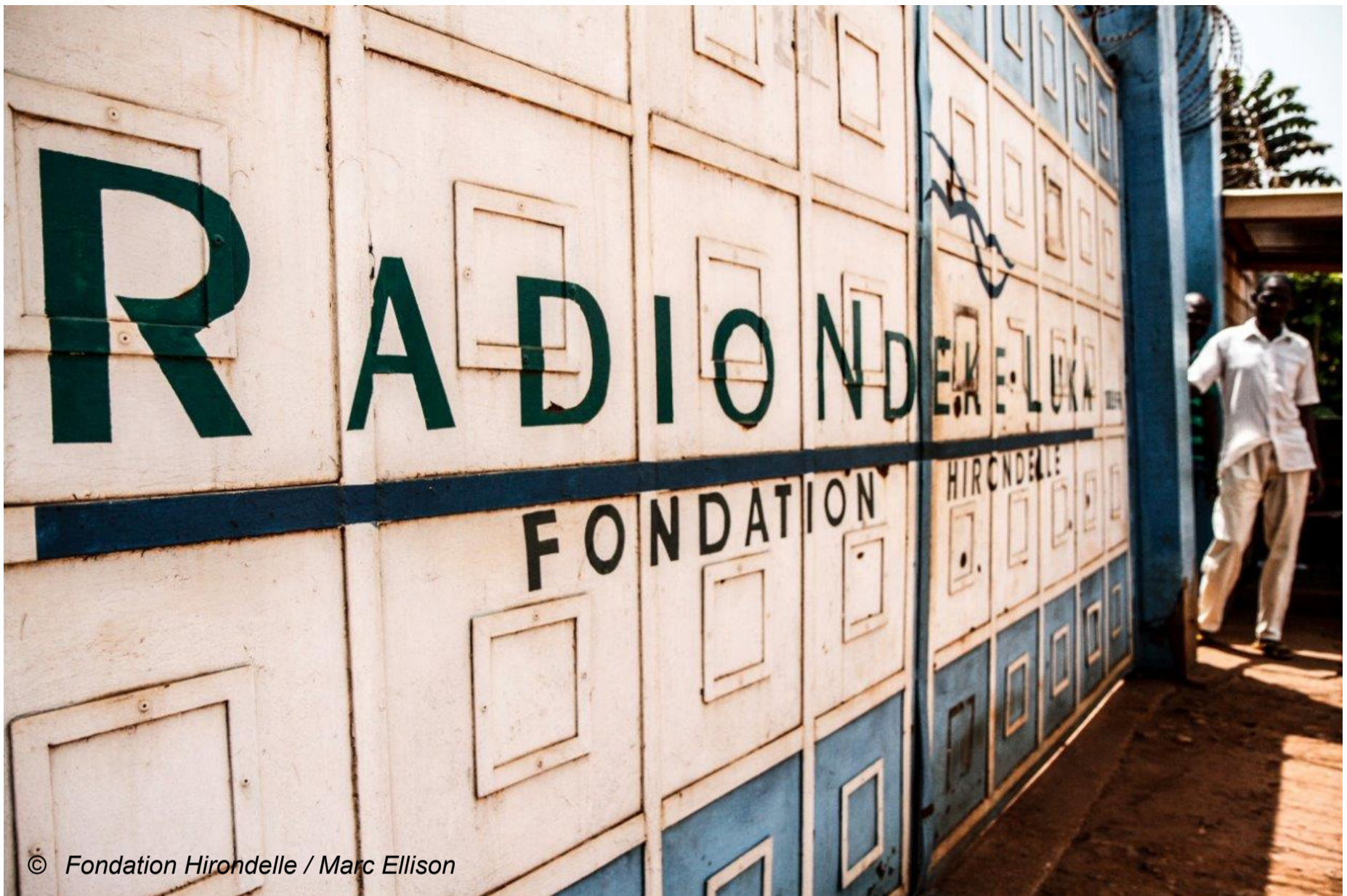
Radio Ndeke Luka, Bangui.