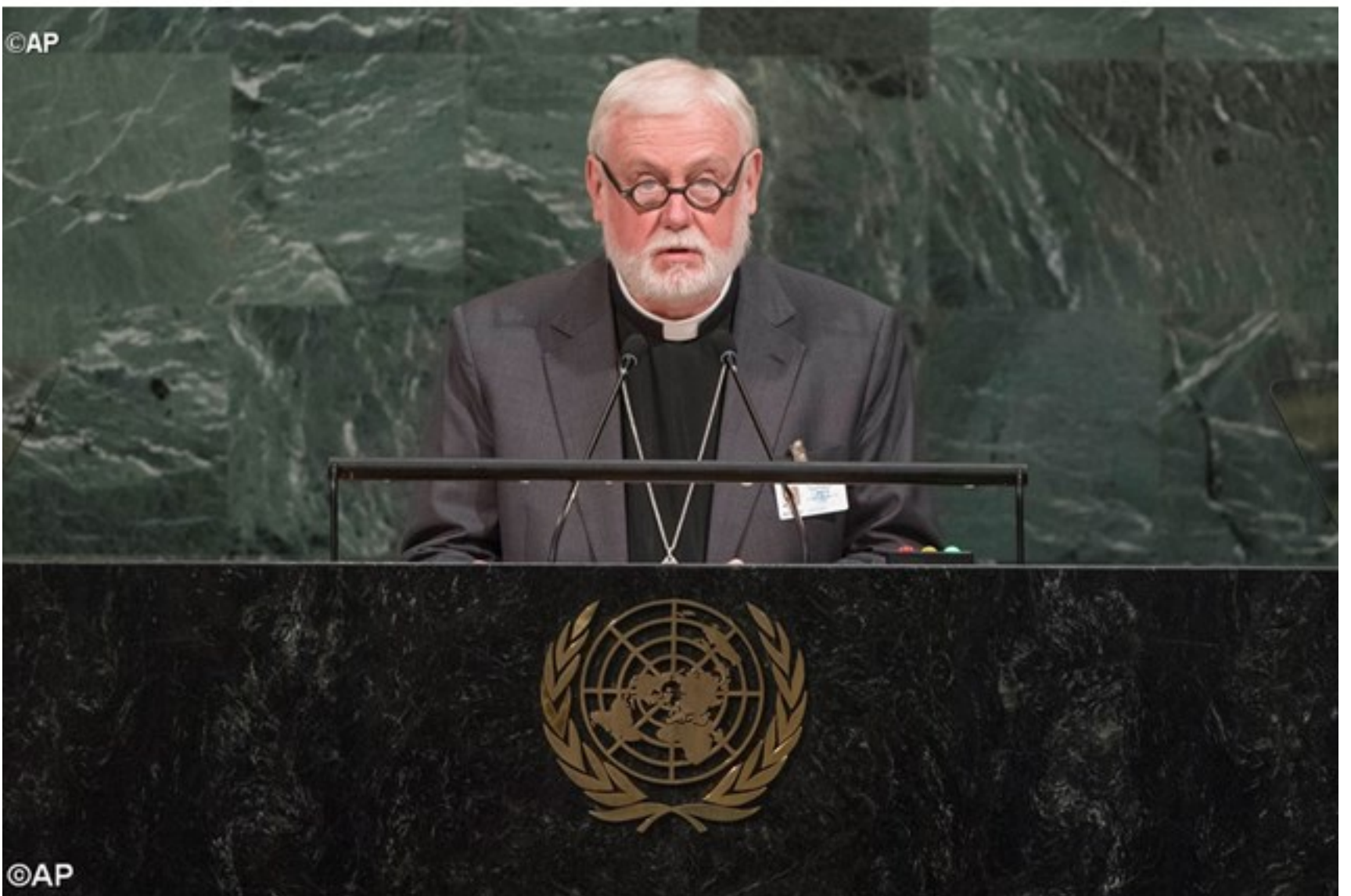
Mgr Gallagher à la tribune des Nations Unies, le 25 septembre 2017.