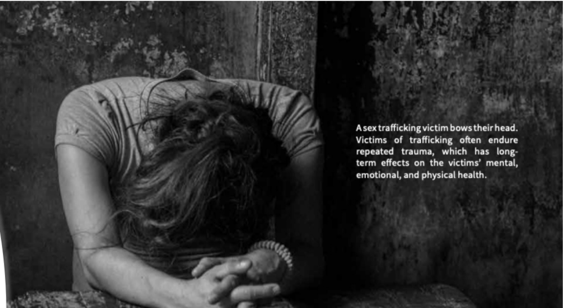
A sex trafficking victim bows their head. Victims of trafficking often endure repeated trauma, which has long-term effects on the victims' mental, emotional, and physical health.